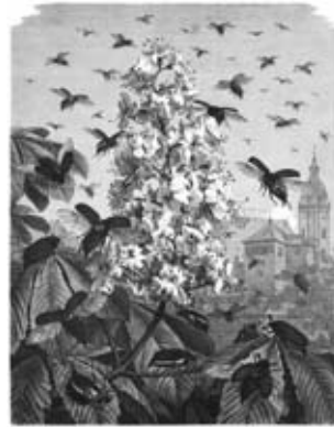
»Maikäfer, flieg!«, Originalzeichnung von Emil Schmidt aus »Die Gartenlaube«, 1879.

Zum Abschluss der lebendigen Erinnerungsrunde sprechen wir bekannte Kinderlieder miteinander – leider dürfen wir ja momentan nicht singen. Auch die Lieder Maikäfer flieg' und Hänschen klein erzählen die Geschichte einer Mutter.